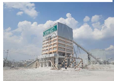
โรงโม่หินของโครงการ