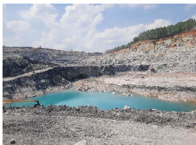
จุดต่ำสุดเป็นพื้นที่รองรับน้ำ