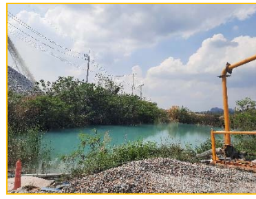
บ่อดักตะกอน