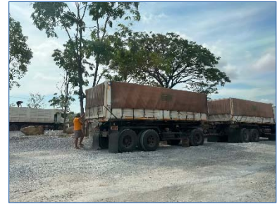
การปิดคลุมผ้าใบรถบรรทุก