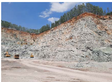
หน้าเหมืองของโครงการ