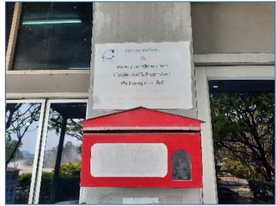
กล่องรับเรื่องราวร้องทุกข์