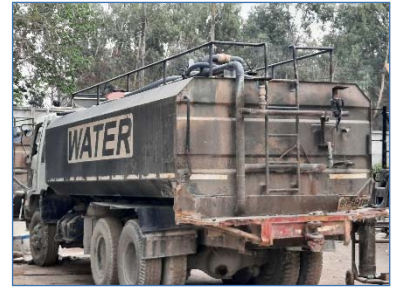
รถฉีดพรมน้ำ