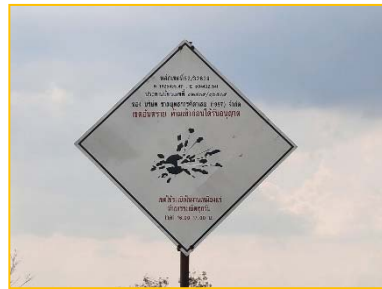
ป้ายเขตอันตรายและเวลาในการระเบิด