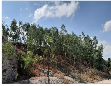
ต้นไม้ปลูกฟื้นฟูภายในโครงการ