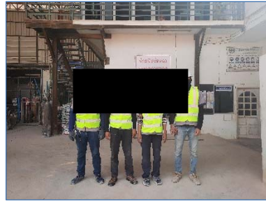
อุปกรณ์ป้องกันอันตราย