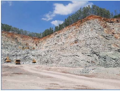
ทำเหมืองลักษณะขั้นบันได